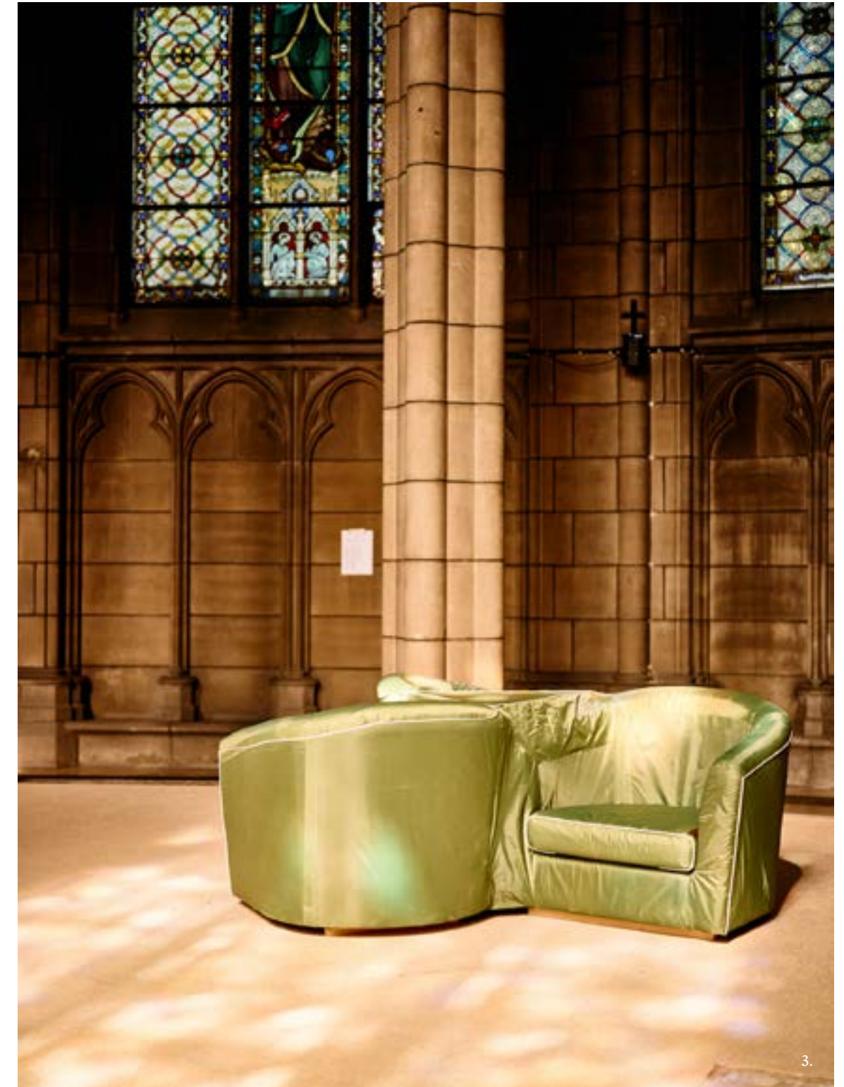
sculpture pièce unique