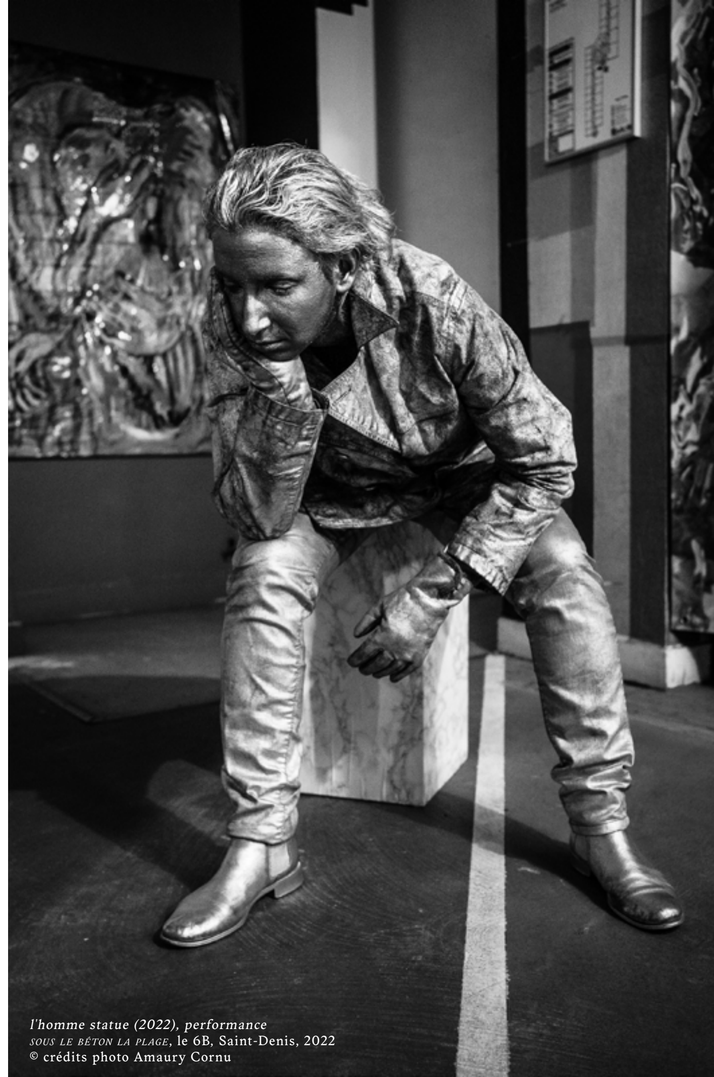
l'homme statue (2022), performance SOUS LE BÉTON LA PLAGE, le 6B, Saint-Denis, 2022

Elle a exposé dans des institutions culturelles comme la Maréchalerie-ENSAV, le Palais de Tokyo, ou le 6B ainsi que dans différentes galeries d'arts en France et en Belgique. Elle a participé à des manifestations culturelles telles que les Journées Européennes du Patrimoine ou le Kunstenfestival de Watou (Belgique).