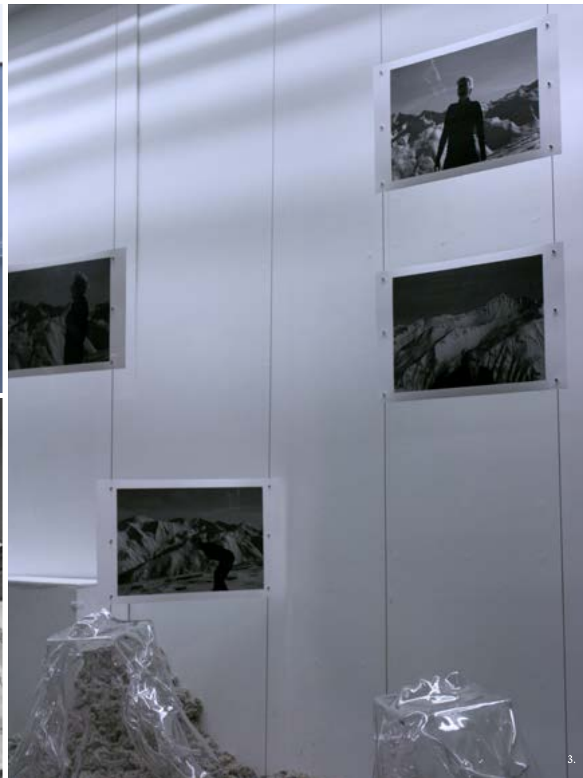
série photographique, 7 tirages

impression Piezo Pro Charbon sur Bright White Hahnemühle 310g 49 x 30 cm