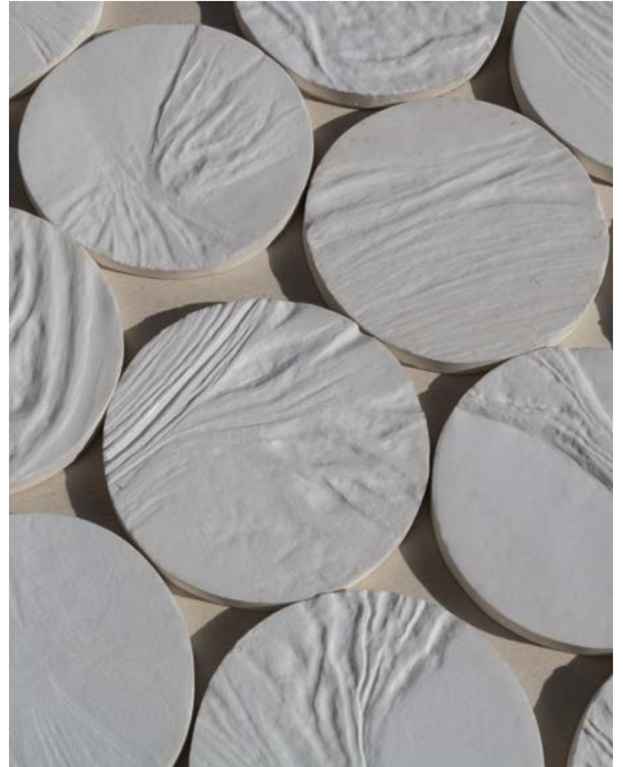
bas reliefs collections privées 65 médaillons en galalithe ø 8 x h 1 cm