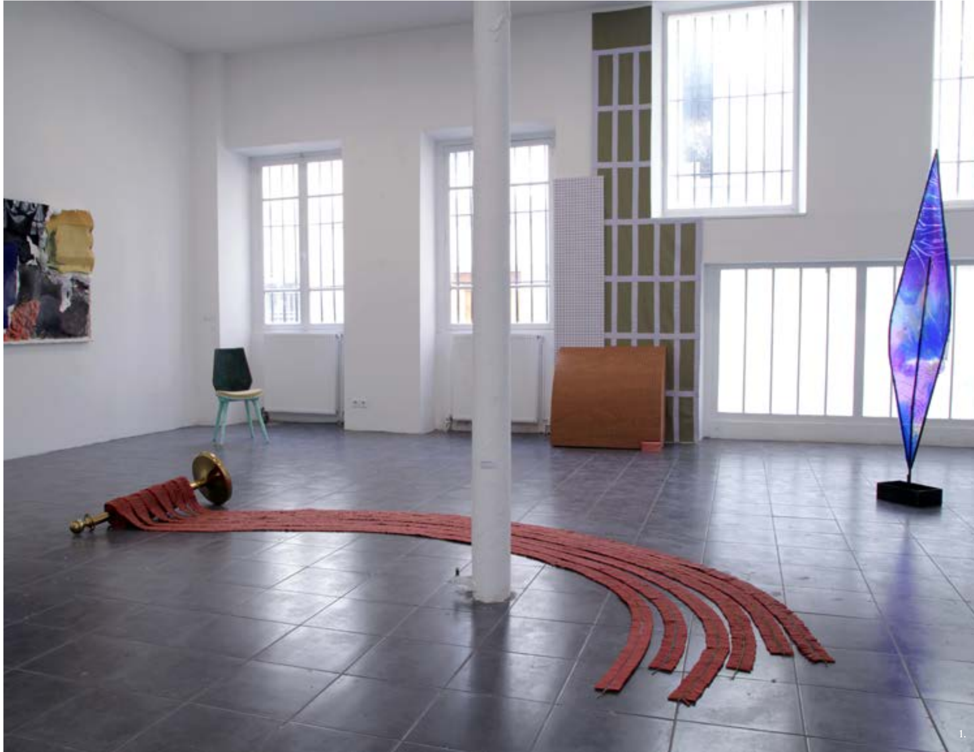
sculpture pièce unique

potelet, 7000 pétards à mèche dimensions variables