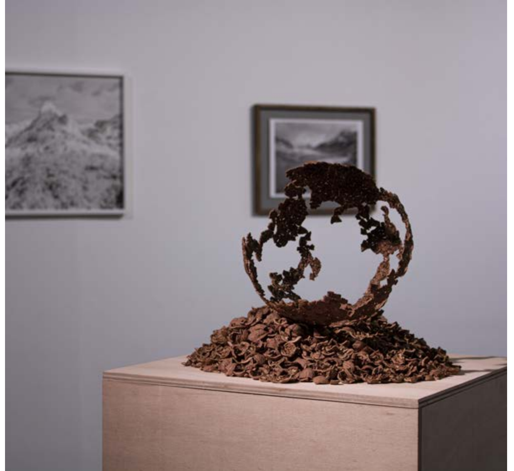
autoportrait à la coque de noix (2022), vue d'exposition UNE IMPRESSION DE DÉRÉALITÉ turbo collectif, Pantin, 2022